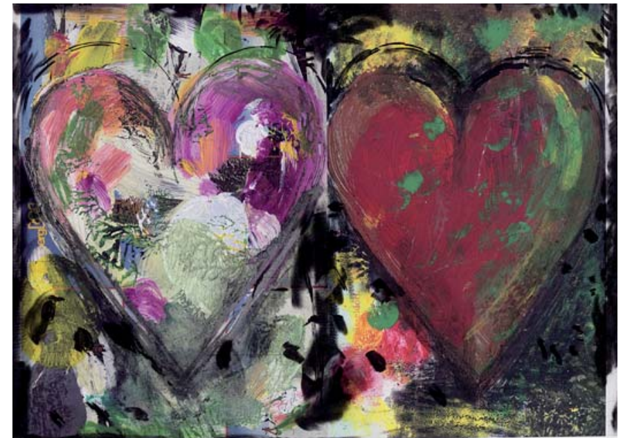
Jim Dine Düsseldorf, dalla serie “Hearts from Nikolaistrasse” 2009 - Digital print Courtesy the artist and Alan Cristea Gallery, London – © Jim Dine by SIAE 2010 - UniCredit Collection

Oltre a costituire un'esperienza unica dal punto di vista musicale, le Prove Aperte rappresenteranno anche un'importante occasione di solidarietà a sostegno di cinque associazioni altamente qualificate e radicate nel territorio milanese, che operano da anni in diversi campi, dall'assistenza sociale a quella socio-sanitaria, dalla ricerca scientifica agli interventi di formazione, aggregazione e prevenzione del disagio giovanile.